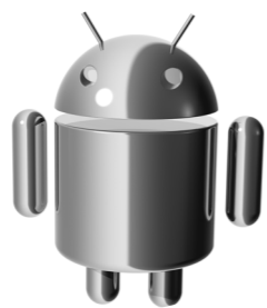
Många idéer kom upp.