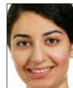
NADIA AL-AYISH RISE

Det som krävs för att minska klimatpåverkan från betongkonstruktioner är att man tidigt i projektet ställer klimatkrav. Det är dessutom viktigt att det finns en samverkan mellan alla aktörer i värdekedjan beställare-konsult-entreprenör-materialleverantör för att identifiera och skapa förutsättningar för att realisera dessa reduktionspotentialer. Ingen av de aktörer som samverkat i projektet hade på egen hand kunnat bena ut de komplicerade samband mellan krav från Trafikverket, eurokoder, betongstandarder, konstruktionsförutsättningar, estetiska krav, produktionsförutsättningar, produktval m.m. som analyserats här. Det finns med andra ord en stor potential till förbättring av hur branschen arbetar gemensamt och systematiskt med att inkludera även klimataspekten i det normala arbetet med att optimera brobyggande. ■