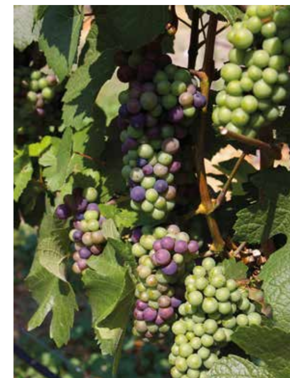
Vindruvor innehåller resveratrol.

Noopept är en prekursor till NFG (nerve growth factor) 5-hydroxytryptofan är en prekursor till serotonin